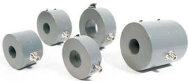
FCC品牌大电流注入探头

FCC品牌的大电流注入探头以满足特定的客户要求，并根据Mil-Std-461 / 462、RTCA / DO-160第20和22部分、Bellcore TR-NWT- 001 089、SAE J15447、EN 55101-4 和CSEFA-2以及其他敏感性规范进行合规性测试。